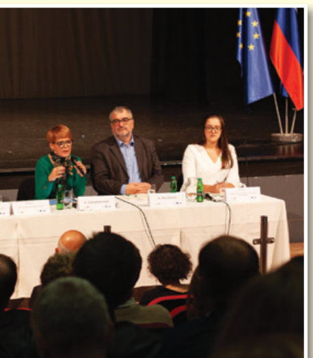
Panelna razprava z ministrico dr. Aleksandro Pivec

Na letošnjem SPP je več kot 360 udeležencev iz 14 evropskih držav razpravljalo o izzivih slovenskega podeželja, skupni kmetijski politiki po letu 2020 in pripravi strateškega