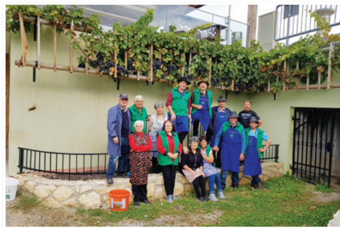
Berači ob potomki najstarejše trte

Prav tako smo se člani društva vinogradnikov, članice društva kmečkih žena in deklet ter člani turističnega društva 5. 10. odpravili na sedaj že tradicionalno vožnjo po Vinski cesti v sosednjo Avstrijo (Weinstrasse). Spetoma smo se ustavili v kraju Gomilica (Ga-