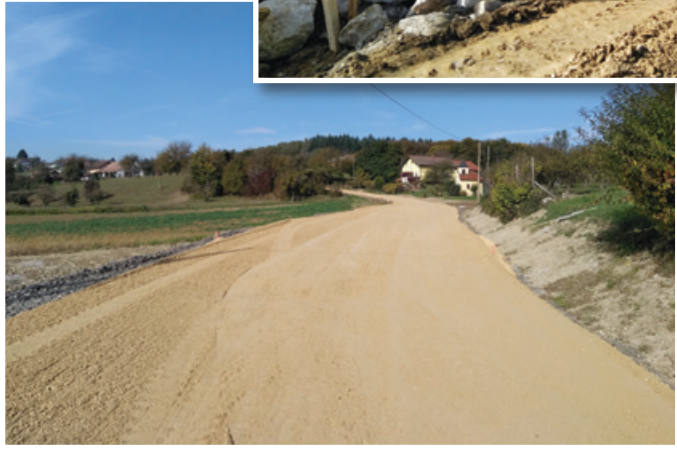
Obnova in širitev ceste v Zg. Voličini