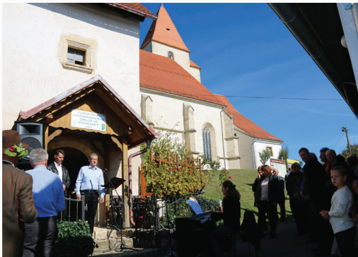
Svečana trgatvev Čolnikove trte v Benediktu.