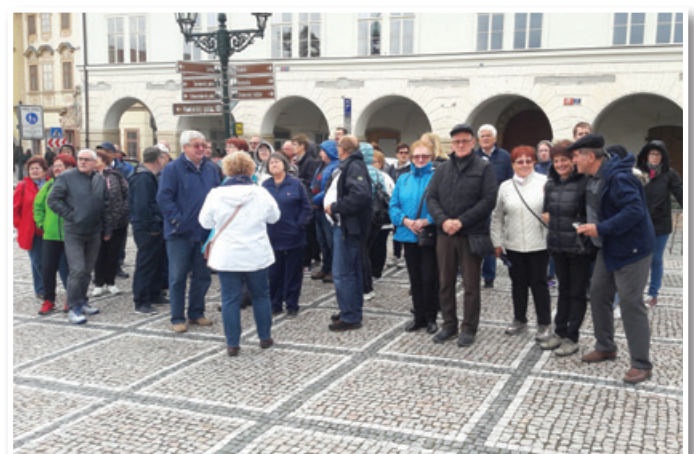
Invalidi MDI Lenart se radi udeležujejo izletov, tokrat so se potepali po Pragi.

Člani izvršnega odbora in poverjeniki so pri-