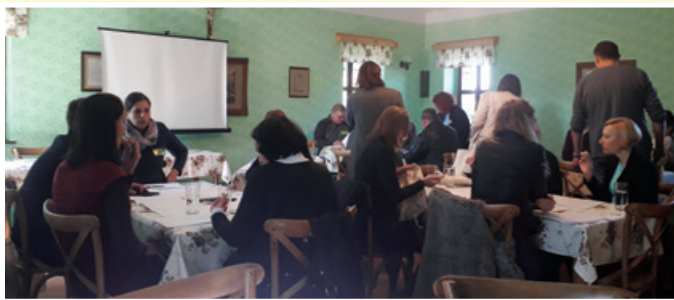
Udeleženci delavnice o lokalnem razvoju podeželskih območij (pristop LEADER/CLLD), foto: M. G.

Na zaključku prvega dne SPP je potekala slovesna razglasitev najuspešnejšega podeželskega območja