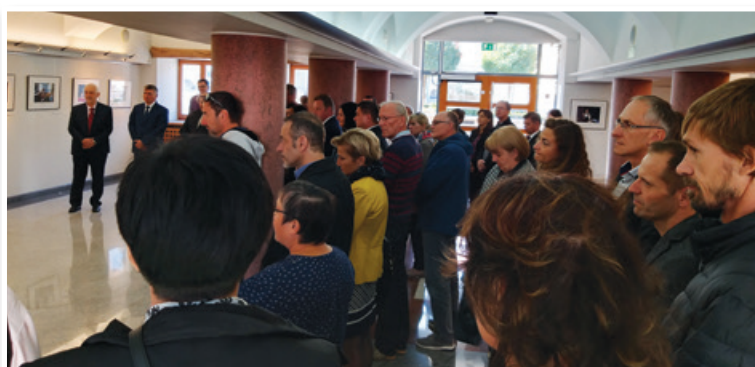
Odprli so prenovljene prostore Upravne enote Lenart.