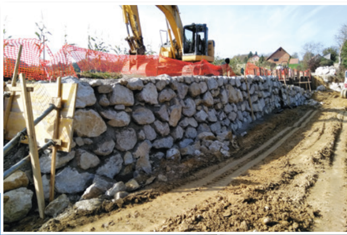
Sanacija plazu v Selcah