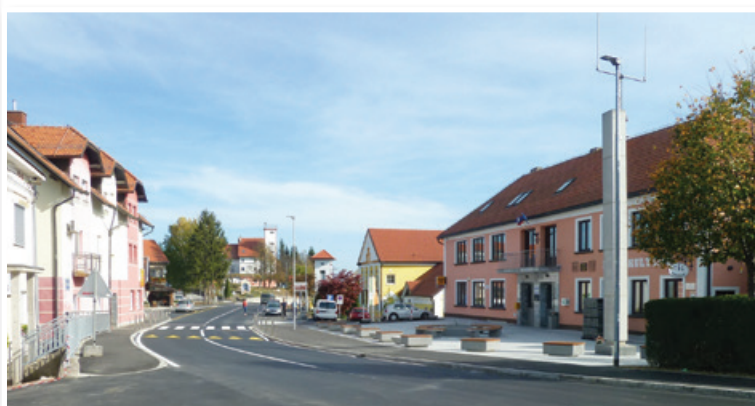
Obnovljeno središče Cerkevjenjaka je dobilo obliko trga.