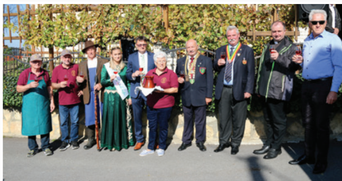
Trgači grozdja ob Čonkovi trti pri Sv. Treh Kraljih