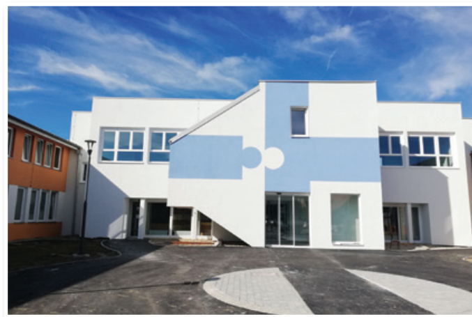
Novi vmesni trakt Zdravstvenega doma Lenart