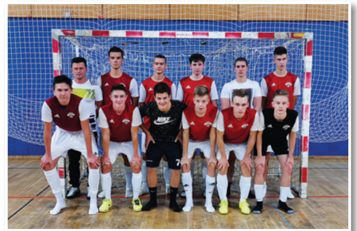
Mlada ekipa Benedikt Slovenske gorice se je na pokalnem članskem futsal tekmovanju MNZ Maribor predstavila v dobri luči.

Miklavž TBS Team24, ki so jo dobili slednji in tako osvojili svoj prvi naslov pokalnih zmagovalec MNZ Maribor v futsalu ter si pridobili vstopnico v nadaljevanje tekmovanja v slovenskem futsal pokalu.