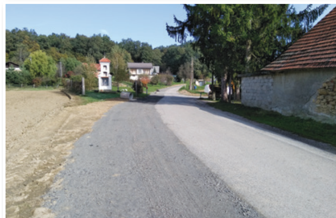
Komunalno opremljanje Lormanja, foto: Andrej Rojs