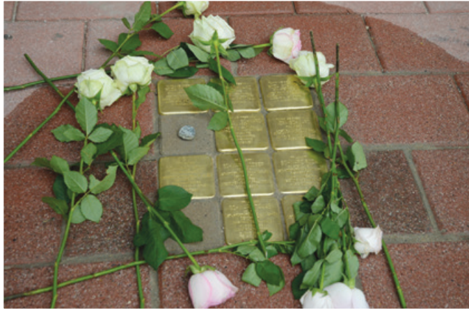
V Lendavi so položili tlakovce spomina pred hišami judovskih družin Blau, Balkany in Schwarz.