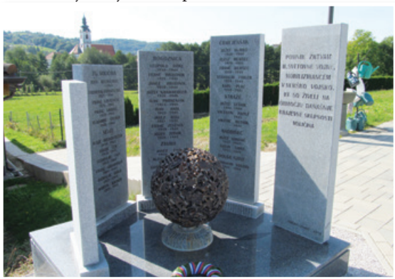
Padli nemški mobiliziranci iz Voličine niso več pozabljeni.

Na pokopališču v Voličini v Slovenskih goricah so ob letošnjem krajevnem prazniku odkrili spomenik prisilno mobiliziranim v nemško vojsko iz območja današnje Krajevne skupnosti Voličina.